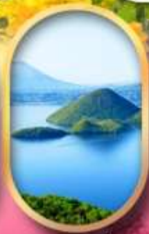
วิวทะเลสาบโทโยะ