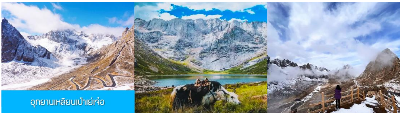
อุทยานเขลิยนเป่าเย่เจ้อ

พักที่ โรงแรม ZUNGE ZHUOYUE HOTEL ระดับ 4 ดาวท้องถิ่นหรือเทียบเท่าในอำเภออาป่า