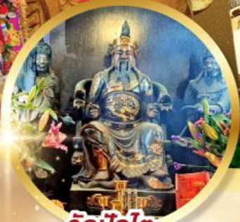
วัดปึกโต

เสริมโชคลาภนำความรุ่งเรือง ทุกด้านของชีวิต