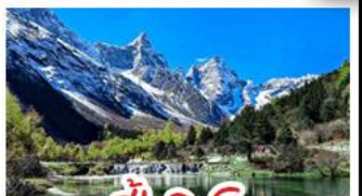
ปี้เฉิงโกว