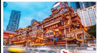
เฉิงเฉิงเฉิง

อุทยานหลุมบ่อฟ้า - อุทยานเจนางฟ้า หงหยาดัง - นังรถไฟทะเลตุ๊ก - อุทยานสีดรุณี ปี้เฉิงโกว - สะพานหนานเฉียว