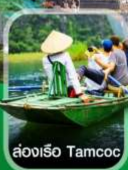
ล่องเรือ Tamcoc

คอนเฟิร์ม ออกเดินทาง ทุกพีเรียด 2 ท่านขึ้นไป