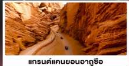
แกรนด์แคนยอนอาถูซื่อ