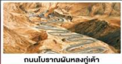
ถนนโบราณผืนหลงกู่เต้า