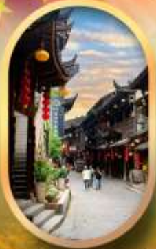
เมืองโบราณฟูหลงเจิน