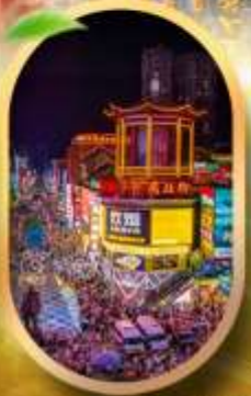
ถนนคนเดินซิงสุ่