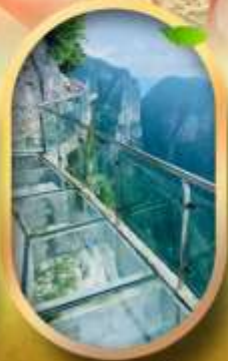
ทางเดินกระจกริมผา