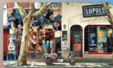
ถนนอันฟู