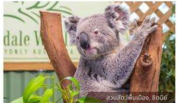
สวนสัตว์พื้นเมือง, ซิดนีย์