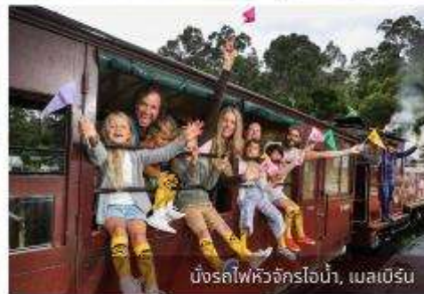
นั่งรถไฟหัวจักรไอน้ำ, เมลเบิร์น