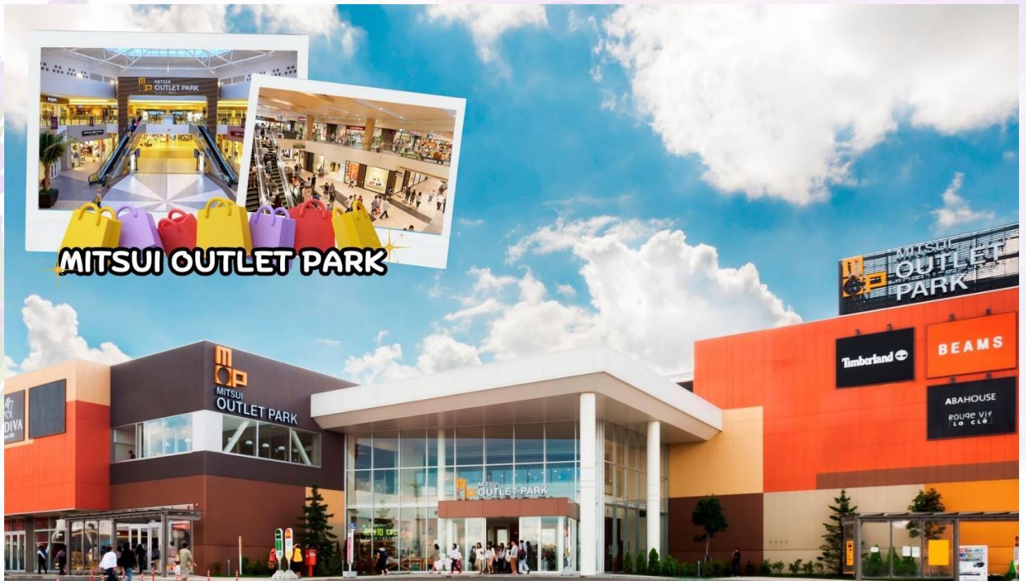
กลางวัน อีสรอาหารกลางวันตามอัยาศัย ณ MITSUI OUTLET PARK SAPPORO