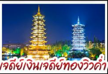
เจดีย์เงินเจดีย์ทองวิวคำ

หมู่บ้านแม่หัวซีเจียง - เขาหุ่ย - กุหลาบพันปี เมืองปี้เจีย เขางวงช้าง - เจดีย์เงินเจดีย์ทองวิวคำ - เขาหุ่ย ซ้อมปิ้งกับถนนคนเดิน ซีเซียง - ซีเจียง เบบูพิเศษ บุฟเฟ่ต์ชาบูซีฟู้ด ปลาอบเบียร์ ฝัอกคริสตล สุกี้เห็ด