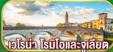
เวโรน่า โรมีโอและจูเลียต