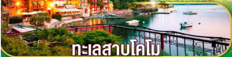
ทะเลสาบโคโม

เดินทาง 07-14 เม.ย. 69 / 02-09 พ.ค. 69 27 พ.ค. - 03 มิ.ย. 69 / 17-24 มิ.ย. 69 22-29 ก.ค. 69 / 11-18 ส.ค. 69 16-23 ก.ย. 69