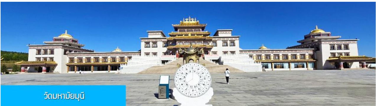
วัดหามัยมุนี

พักที่ YULIN CHAOYANG INTER HOTEL โรงแรมระดับ 4 ดาวท้องถิ่น หรือเทียบเท่าในเมืองหยี่หลิน