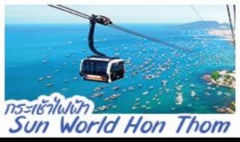
กระเช้าไฟฟ้า Sun World Hon Thom