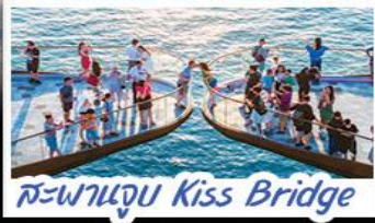
สะพานจูบ Kiss Bridge