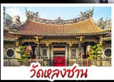
วัดเจหลงซาน