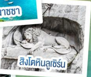
สิงโตหินลูซิิร์น