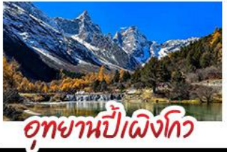
อุทยานป่าเข็ญทิว

อุทยานสี่ฤดู - อุทยานป่าเข็ญทิว - อุทยานจิวจ้ายทิว รถไฟความเร็วสูง - EASTERN SUBURB MEMORY ถนนโบราณความจำ - วัดต้าฉือ ช้อปมังฮานตัง ถนนไท่กู่หลี่ + ถนนซุนซีลู่