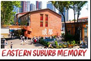
EASTERN SUBURB MEMORY