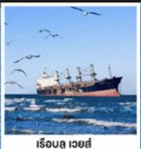
ริเออตู เวย์ส์