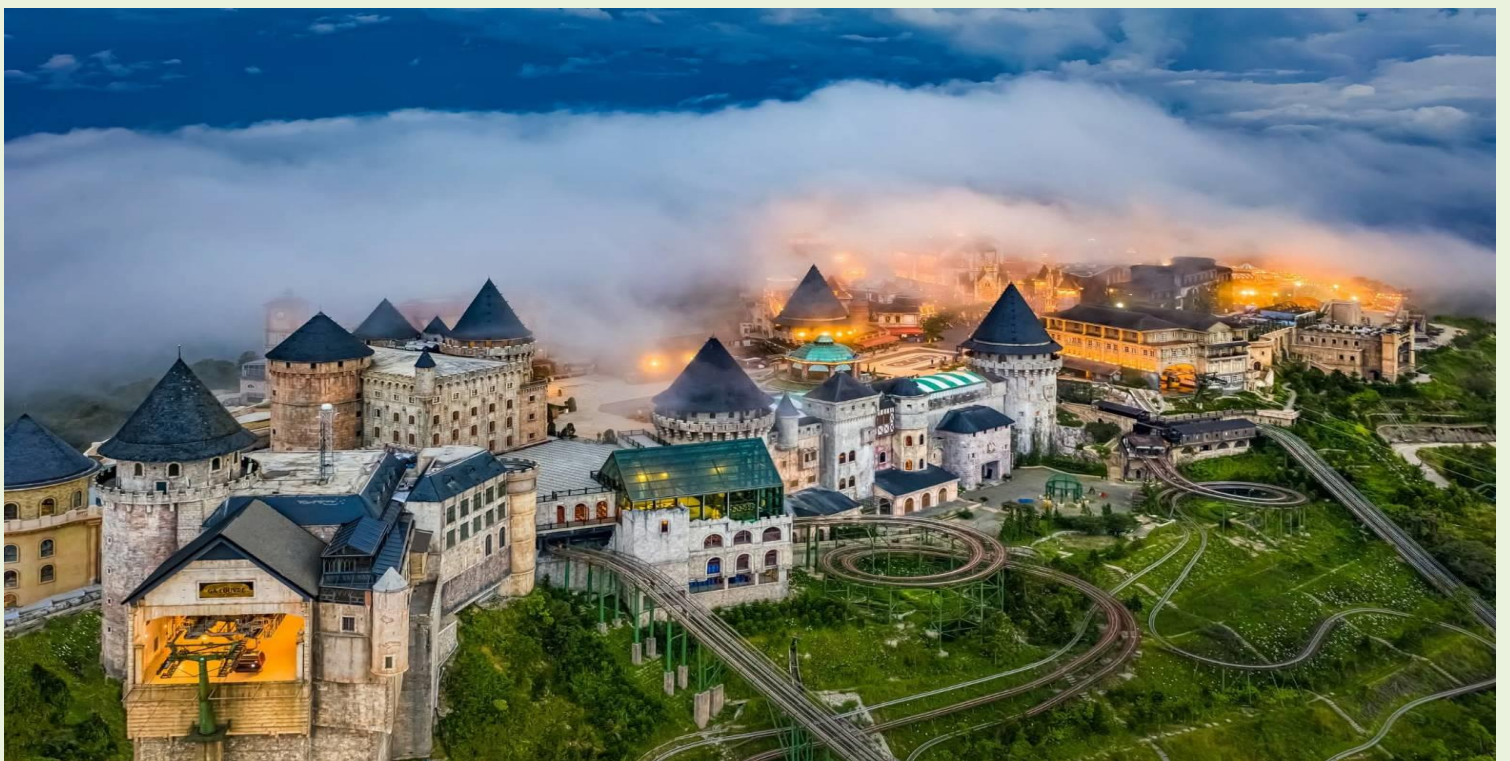
2UDAD-EK005 หลงเสน่ห์ เวียดนามกลาง ดานัง ฮอยอัน พักบานาฮิลล์ 1 คืน (ไม่ลงร้านช้อปปิ้ง) 3 วัน 2 คืน โดยสายการบิน Emirates Airlines (EK) Update 08 Apr 26