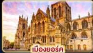
เมืองยอร์ก