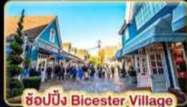
ช้อปปิ้ง Bicester Village