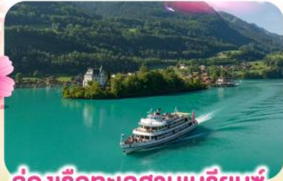
ล่องเรือทะเลสาบเบรียนซ์

พีชียอดเขาชุนเนกกา 1 ในเขาที่สวยงามที่สุดเมืองเซอร์แมก