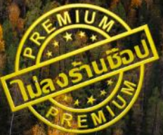
หาดห้าสี