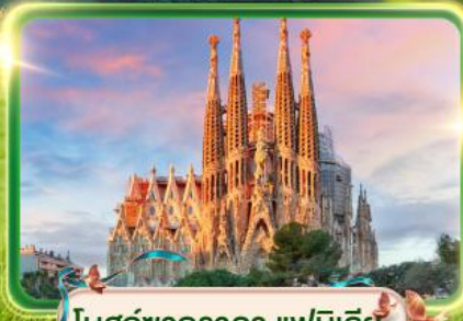
โบสถ์ซากราดา แฟมิลีย