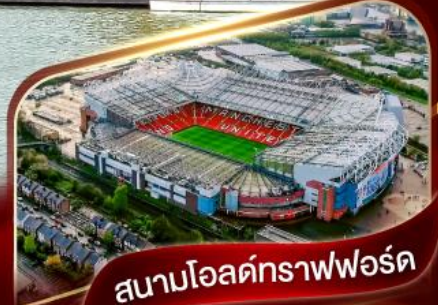
สนามโอลด์แทรฟฟอร์ด