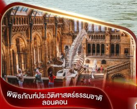
พิพิธภัณฑ์ประวัติศาสตร์ธรรมชาติ ลอนดอน