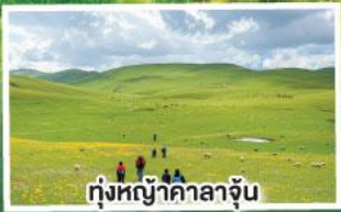
ทุ่งหญ้ายาคาลาจูน