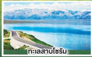
ทะเลสาบไซรัม