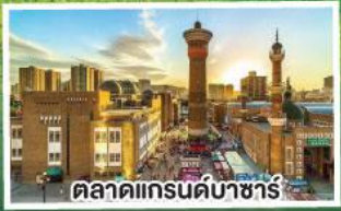
ตลาดแกรนด์บาซาร์