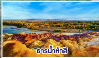
ธารน้ำห้าสี