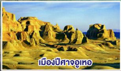
เมืองปีศาจอูเทอ