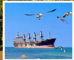
เรือสินค้าเกย์ตันบลูอิส