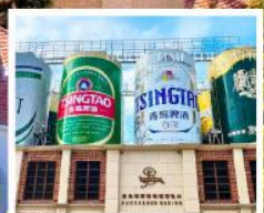
พิพิธภัณฑ์เบียร์ชิงเต่า