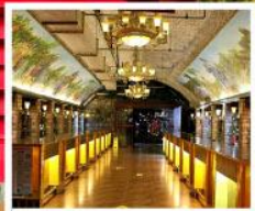
พิพิธภัณฑ์ไวน์ชิงเต่า