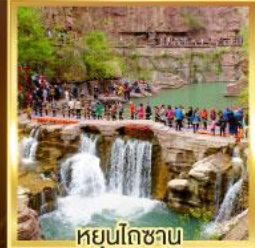
หยุ่นโกซาน