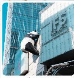
IFS ตึกหมีแพนด้า

● ไอโกล์ นั้งกระเช้าขึ้นชมภูเขาหิมะวาวู๋ ซือบปิ้งถนนชุนซีลู่ แลนด์มาร์คแพนด้ายักษ์เป็นตึก IFS เจิงตุ