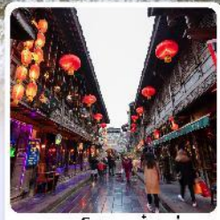
ถนนโบราณจีนหลี่