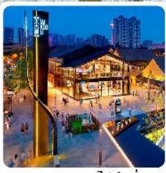
ถนนคนเดินไท่กุหลี่