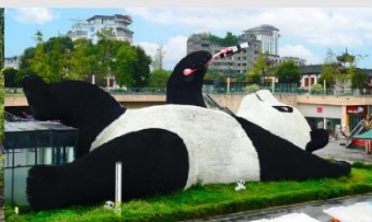
รูปปั้นหมีแพนด้าอนเซลฟี