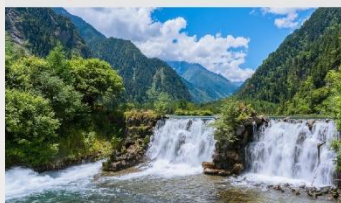
อุทยานแห่งชาติปี่เฟิงโกว