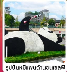
รูปปั้นหมีแพนด้าอนุเชลฟี