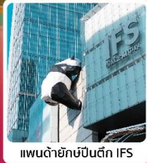
แพนด้ายักษ์ปั้นตึก IFS

TFU3U1426 | 4 วัน | 2 คืน | เมนูพิเศษ | พักรักษา | Sichuan Airlines สุกีน่าล่า | ระดับ 4 ดาว | น้ำหนักกระเป๋า 23 kg.