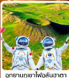
อุทยานภูเขาไฟอุลันฮาตา