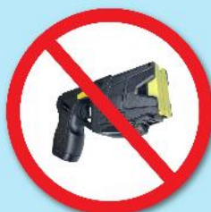
ปืนซ็อตไฟฟ้า