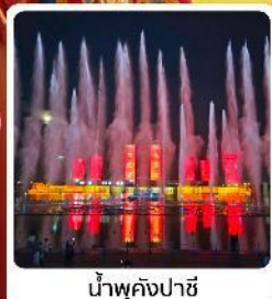
น้ำพุคังปาสี

● โอโลกั เป็นทรายเสียงชาวาน แหล่งท่องเที่ยวระดับ 5A ของจีน ภูเขาไฟอุลันฮาตา น้ำพุคังปาสี น้ำพุที่สูงที่สุดในเอเชีย