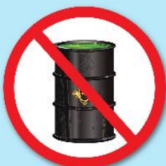
สารกัมมันตรังสี