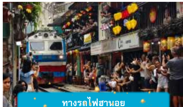
ทางรถไฟฮานอย