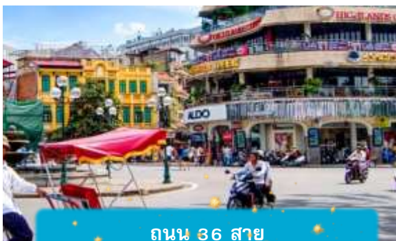
ถนน 36 สาย

21.05 เดินทางถึง สนามบินสุวรรณภูมิ ประเทศไทย โดยสวัสดิภาพ ... พร้อมความประทับใจ