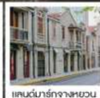
แลนด์มาร์กจางหยวน

เซี่ยงไฮ้ คคลาสสิก ไนท์ / 3 ดึกใหญ่แห่งเซี่ยงไฮ้ คองเรือหมู่บ้านโบราณจูเจียเจียว / EKA Tianwu / วัดหลงหัว แลนด์มาร์ก จางหยวน / ถนนหวยไห่ / ชมโชว์ ERA ที่โรงละครโด่งดังระดับโลก / ซินเทียนตี้