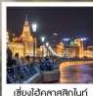
เซี่ยงไฮ้ คคลาสสิกไนท์