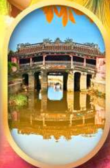
เมืองเก่าฮอยอัน