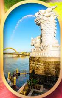
คาร์พดราท็อน