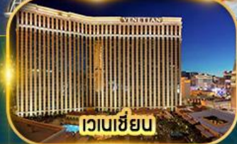
เวเนเซียน