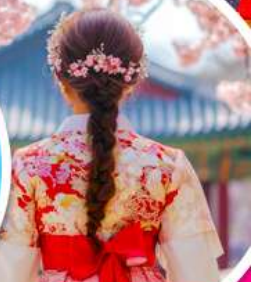
ชมอย่างเกาหลีสี่