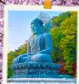
วัดชินอิงซา