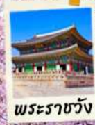
พระราชวัง