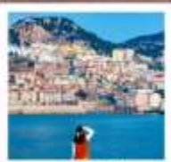
หาดซาโจ่ว

หอออกกาลเวศา • ชายหาดจินซา • จุดบันปัสวางเฟ • แปดเซียนฮันทะเล สวนเหยียนโกซาน • ถนนโบราณเตาหยาง • WEI HAI WINDOW • ถนนฮิวจวิเป่า เรือบลูวิศ • ย่านฮั่นเสอฝาง • หาดทรายซาโจ่ว • ถนนหลงเจียง พิพิธภัณฑ์ที่ว่าการเก่าเยอรมัน • สะพานข้ามเจียว • ถนนจงซาน โบสถ์ St. Emil • หาดไซเบอร์ NO.3 • สวนจงซาน • ป่าด้ากวน QINGDAO HAITIAN CENTER ชั้น81 • ถนนเทียนชางหาดปิ่นใหญ่จันเต่า โรงงานเบียร์ชิงเต่า • ถนนกมตันโก่ตง • ศูนย์เรือใบโกลัมปีท