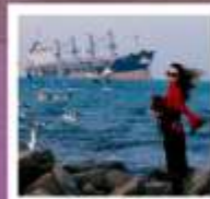
เซินซูวิศ

ทัวร์คุณธรรม ไม่ลงร้านช้อปปิ้ง ไม่ขายออฟชั่น