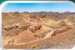
ชารินแกรนด์แคนยอน