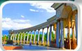
1st President Park