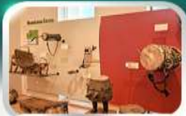
Museum of Folk Instrument