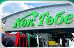
ซิมโกลโกเบชมวิวอักแทร์

นั่งกระเช้าซิมบูลัค-ทะเลสาบโคลไซ-โบสถ์เซมคอฟ