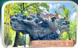
Panfilov Guardsmen Park