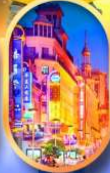
ถนนหนานกิง