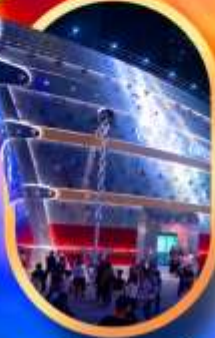
เรืออะพลุส์