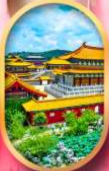
เมืองจำลองสามก๊ก