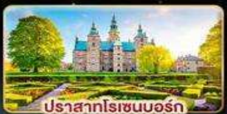
ปราสาทโรเซนบอร์ก