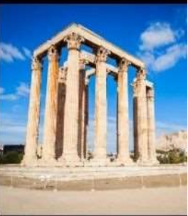
Temple Of Olympian