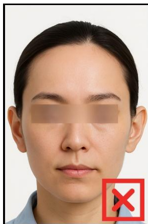
รูปที่ไม่ได้ขนาด ตามที่สถานทูตกำหนด