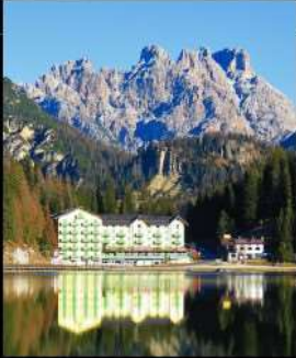
ทะเลสาบบิสุรีน่า