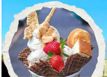
ร้านไอศกรีมมิยาฮาระ