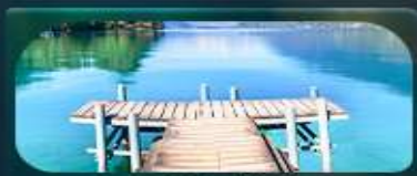
อิซิคส์วัลด์