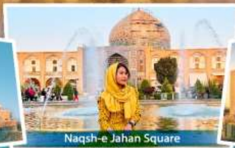
Naqsh-e Jahan Square