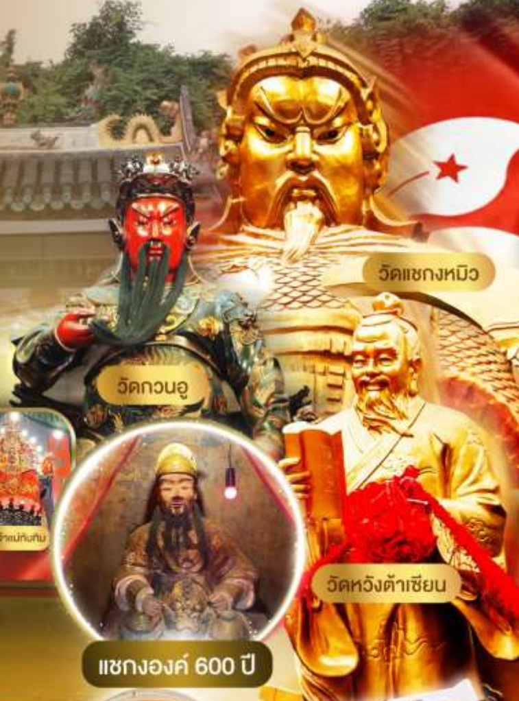
วัดแซกงหมิว