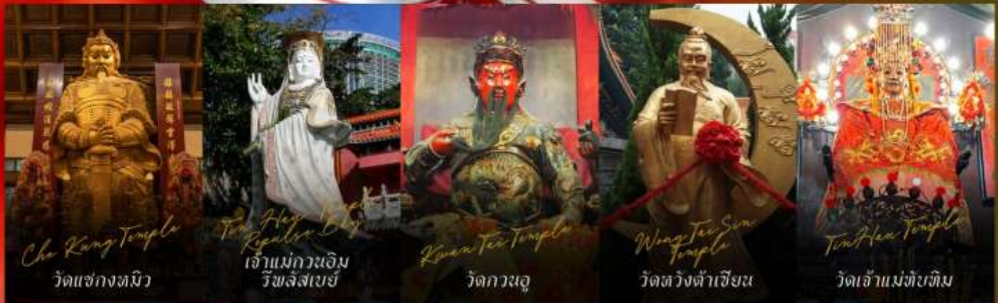
Che Kung Temple วัดแชกงหมิว

รายการทัวร์ข้างต้นอาจมีการปรับเปลี่ยนเพื่อความเหมาะสม