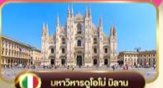
มหาวิหารดูโอโม มิลาน

นั่งรถรางขึ้นชมวิวชาริค • อินเทอร์ลาเคน • มิลาน • หมู่บ้านซิงเกว แตร์เร • หออนนิซ่า • ชมนครรัฐวาติกัน • ท่องเที่ยวกรุงโรม