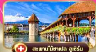
สะพานไม้ชาเปล ลูเซิร์น