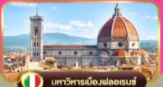
มหาวิหารเมืองฟลอเรนซ์