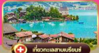
เที่ยวทะเลสาบบริยอนซ์