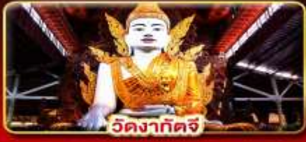
วัดงาทัดจี